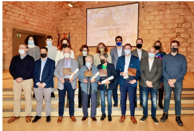
Imatge de família dels premiats “Cornelius Atticus 2019” i “Cornelius Atticus 2020”.