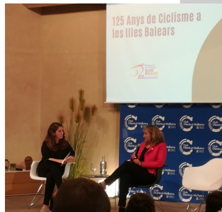
Acte de celebració dels 125 Anys de Ciclisme a les Illes Balears al Club Diario de Mallorca