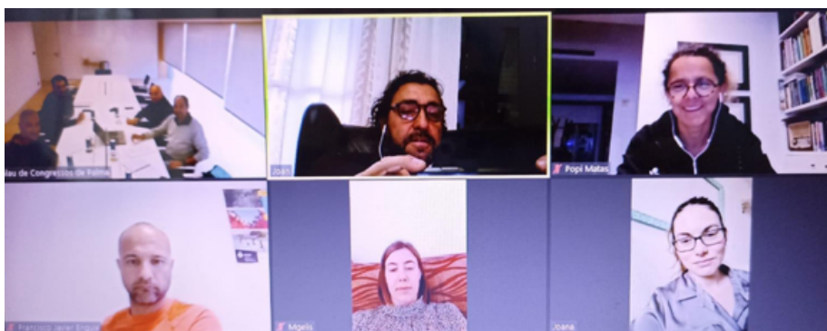
Imatge del membres de la Junta Directiva de l'AGEPIB en reunió del passat 4 de maig.

Al Palau de Congressos de Palma es va celebrar la Reunió de la Junta Directiva de l'AGEPIB, segons l'Ordre del Dia establert. Va ser una reunió híbrida (presencial i telemàtica) amb una alta participació dels membres de la Junta. Es va fer un repàs de les activitats més importants realitzades el mes anterior, que es poden veure en el IV Full informatiu que es recull més abaix, així com la previsió de les activitats a realitzar en un futur immediat. Després de l'informe del Secretari i la Tresorera es van proposar determinades accions formatives així com la preparació del contingut de la II Jornada d'Innovació esportiva (mes d'octubre) i els Premis AGEPIB 2022 (mes de novembre). Agraïm al Palau de Congressos de Palma la cessió de les seves extraordinàries instal·lacions.