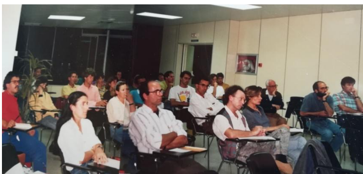
Jornada “El Llicenciat en Educació Física Avui”. Palau d’Esports. Palma 21 maig 1982

Des de l’AGEPIB volem destacar que és un vertader honor poder recordar i gaudir d’aquesta part important de la història de l’Educació Física i l’Esport de la nostra societat. Gran part del desenvolupament de l’activitat física i l’esport d’avui es deu a la seva dedicació, professionalitat i a la d’altres companys d’aquella època.