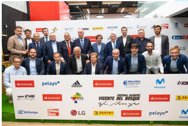
Delegació mallorquina juntament amb els organitzadors i altres assistents en la presentació del "Mallorca International Futbol Cup Vicente del Bosque".