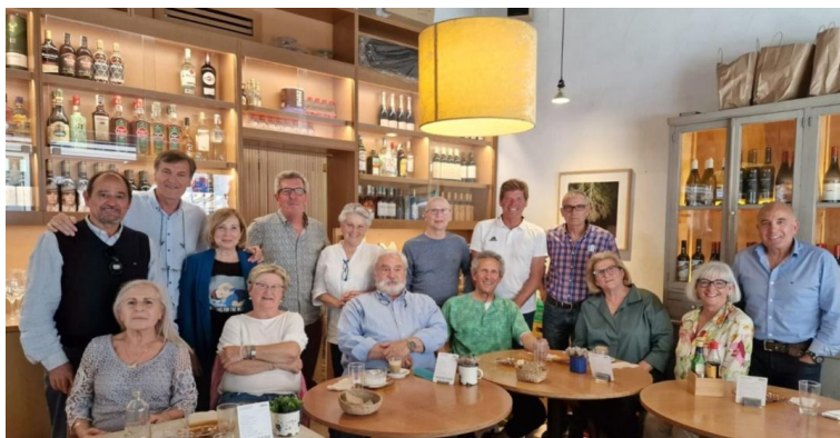
Pioners de la Educació Física i l’Esport . Palma 12 maig 2022