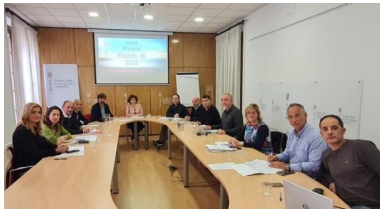
Conselleria Govern Balear. Palma, 21 de novembre.