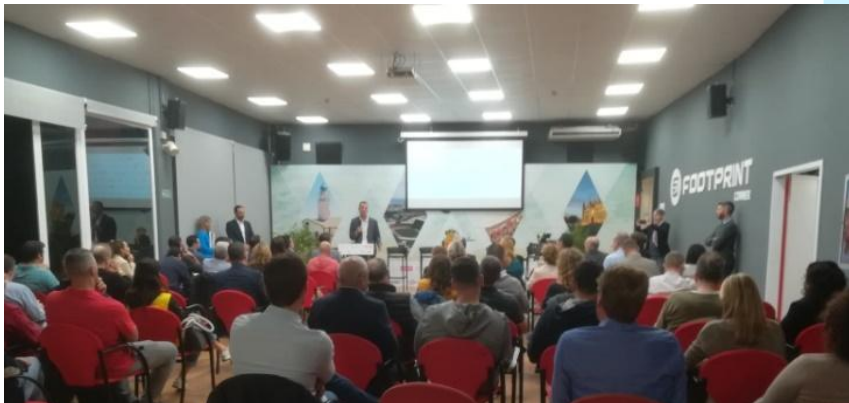
Estadi Son Moix. Palma, 11 de novembre

Organitzat per la DGE del Govern de les Illes Balears i el CSD a la seu del RCD Mallorca.