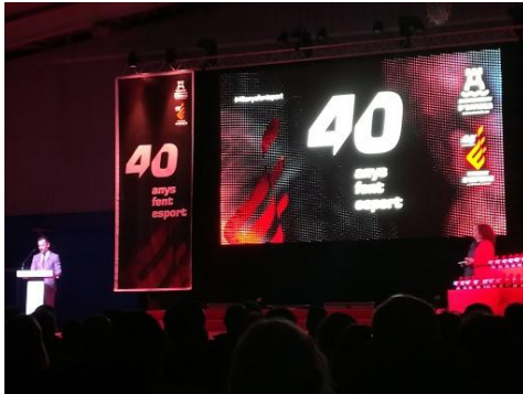
Eivissa, 21 de febrer.