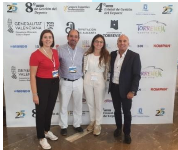
Representació JD AGEPIB. 20 i 21 octubre. Torreveja