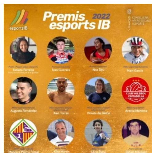
Gala, Palau de Congressos, 19 desembre.