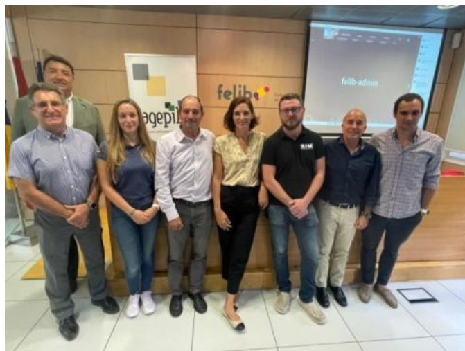
Cartell i ponents de la Jornada.