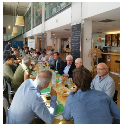
Miembros y patrocinadores de la AGEPIB participaron en el acto social después de la Asamblea.