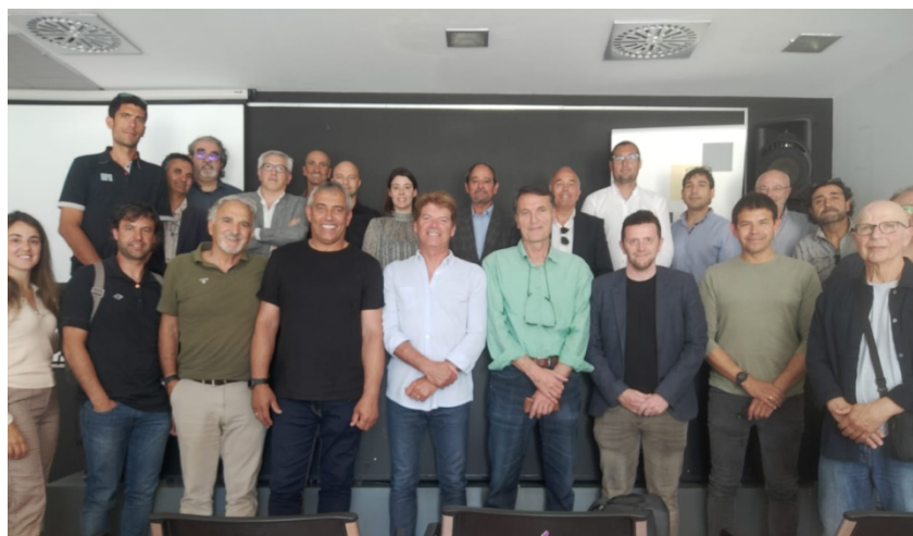
Miembros asistentes a la Asamblea Ordinaria de la AGEPIB el pasado 25 de abril en el Velódromo Illes Balears

Posteriormente en la Asamblea Extraordinaria, se aprobó empezar el proceso electoral para elegir a un nuevo Presidente que presentará su Junta Directiva. Se decidió que el actual JD continuara como Junta gestora hasta el plazo del proceso electoral y la incorporación de la nueva Presidencia elegida.