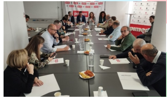
Diferentes momentos de las reuniones de PIMEM en las que los candidatos políticos explican sus propuestas