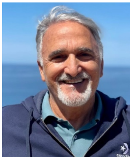
Licenciado en Educación Física y Deportiva por el INEF de Madrid (Universidad Politécnica) Ex Gerente del Servicio municipal de deportes de Santurze (País Vasco) Fundador de FAGDE y KAIT Ex-gerente de FAGDE (2015-2019)

Por último, una reflexión sobre las instalaciones deportivas (IIDD). Las instalaciones y sus espacios deportivos siguen siendo elementos esenciales del sistema deportivo de un municipio, región o estado. Y son esenciales en el plan de negocio de todos los centros privados de fitness. A pesar del crecimiento de las prácticas out door, las IIDD van a seguir siendo un eje imprescindible de la política deportiva. Su papel es y será fundamental, ya que son el soporte de la mayoría de los programas de actividades, ya sea con un propósito de salud, educación, recreación o competición. Los espacios deportivos deben dar respuestas satisfactorias a todas estas necesidades. Hoy, de nuevo, como se hizo en los años ochenta y noventa, hay que (re)planificar, (re)diseñar y (re)programar las IIDD para que sean verdaderos motores de la activación física, para que el deporte se incorpore a los hábitos cotidianos de la mitad de la población todavía sedentaria. Muchas de las IIDD actuales, la inmensa mayoría de las construidas hace 30-40 años, requieren de reinversiones económicas muy cuantiosas en reformas integrales para volver a ser atractivas, rentables y sostenibles.