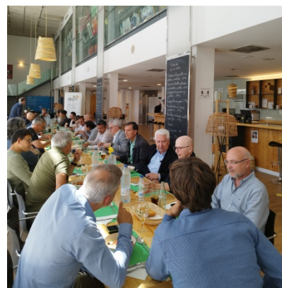
Membres i patrocinadors de l'AGEPIB varen participar en l'acte social després de l'Assemblea.