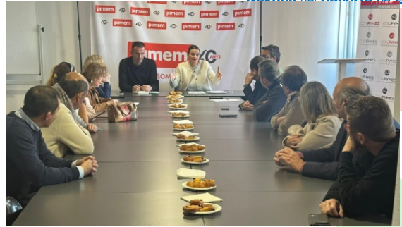
Diferents moments de les reunions de PIMEM on els candidats polítics expliquen les seves propostes