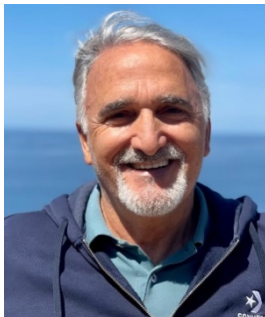
Llicenciat en Educació Física i Esportiva per l'INEF de Madrid (Universitat Politècnica) Ex Gerent del Servei municipal d'esports de Santurze (País Basc) Fundador de FAGDE i KAIT Ex-gerent de FAGDE (2015-2019)

Per últim, una reflexió sobre les instal·lacions esportives (IIDD). Les instal·lacions i els espais esportius continuen sent elements essencials del sistema esportiu d'un municipi, regió o estat. I són essencials en el pla de negoci de tots els centres de fitness privats. Tot i el creixement de les pràctiques out door, les IIDD continuen sent un eix imprescindible de la política esportiva. El seu paper és fonamental i serà fonamental, ja que són el suport de la majoria dels programes d'activitats, ja sigui amb un propòsit de salut, educació, recreació o competició. Els espais esportius han de donar respostes satisfactòries a totes aquestes necessitats. Avui, novament, com es va fer als anys vuitanta i noranta, cal (re)planificar, (re)dissenyar i (re)programar les IIDD perquè siguin veritables motors de l'activació física, perquè l'esport s'incorpori a els hàbits quotidians de la meitat de la població encara sedentària. Moltes de les IIDD actuals, la immensa majoria de les construïdes fa 30-40 anys, requereixen reinversions econòmiques molt quantioses en reformes integrals per tornar a ser atractives, rendibles i sostenibles.