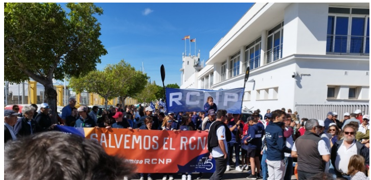
Dues imatges de la manifestació massiva en recolzament a la continuïtat del RCNP el passat 15 d'abril