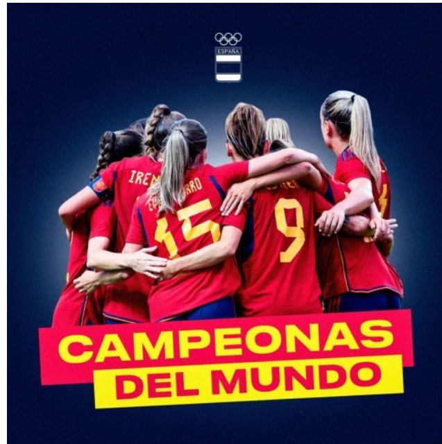
AGEPIB con las campeonas del mundo de fútbol femenino.