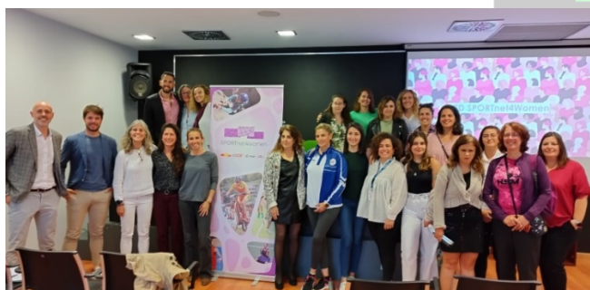
Participantes gestoras en el curso “Mujeres Dirigentes del Deporte”.