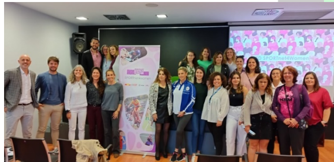
Participants gestores al curs “ Dones Dirigents de l’Esport”.